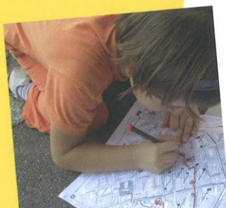
Quartieranalyse – Orte und Wege aus Kindersicht.

Wohnumfeld/Innenhöfe Schulraumentwicklung KinderMitWirkung Beratung und Schulung