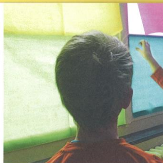
Mehr Farbe – Kinder gestalten ihre Schulräume.

Das Kinderbüro Basel ist Anlaufstelle für Kinderanliegen und Kinderrechte in Basel.