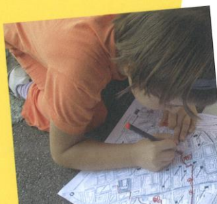
Quartieranalyse – Orte und Wege aus Kindersicht.

Wohnumfeld/Innenhöfe Schulraumentwicklung KinderMitWirkung Beratung und Schulung