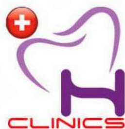
Helvetic Dental Clinic